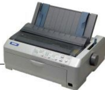
Drucker für Wiegescheine mit Durchschlägen